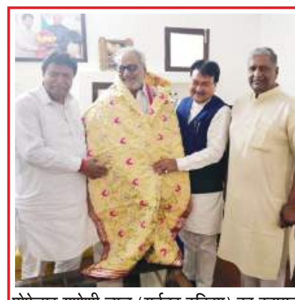
प्रोफेसर गणेशी लाल (गर्वनर उडिसा) का स्वागत करते हुए हरियाणा विधानसभा के स्पीकर ज्ञान चंद गुप्ता, राष्ट्रीय कवि संगम के राष्ट्रीय अध्यक्ष जगदीश मित्तल और पूर्व जिला अध्यक्ष रोशन कंसल।

को इस प्रकार के सेवा के कार्य अपने-अपने क्षेत्र में अधिक से अधिक करने चाहिए और हमेशा ही सत्य का साथ देना चाहिए। उन्होंने आगे बताया कि श्री राधाकृष्ण दर्शन परिवार गऊ को लेकर भी कई अभियान चला जा रहा है और समय-समय पर श्री राधाकृष्ण दर्शन परिवार के द्वारा कई अन्य कार्यक्रमों का आयोजन भी किया जा रहा है। साथ ही श्री राधाकृष्ण दर्शन परिवार के प्रयासों से क्षेत्र में स्वच्छता का भी महल है। इसके लिए मैं श्री राधाकृष्ण दर्शन परिवार की पूरी टीम को बधाई देता हूँ। इस मौके पर कई गणमान्य लोग मौजूद रहे और नवनियुक्त संरक्षक का स्वागत किया।