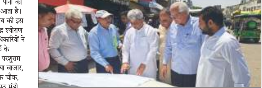
जाता है और लोगों को आने जाने में काफी कठिनाई का सामना करना पड़ता है। उस दौरान शहरवासियों ने उनके समक्ष सिरसा शहर में बरसाती पानी की उचित निकासी न